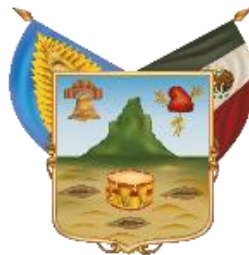
Estado Libre y Soberano de Hidalgo