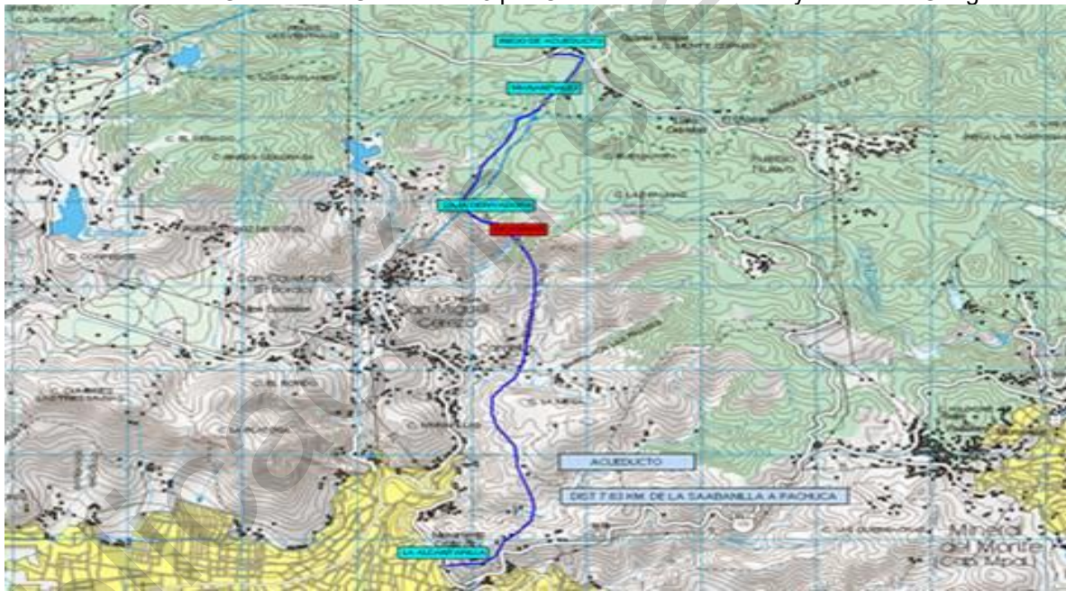
Trazo realizado por el C. Zenón rosas franco con GPS marca Garmi Félix 3, utilizando cartografía de INEGI,