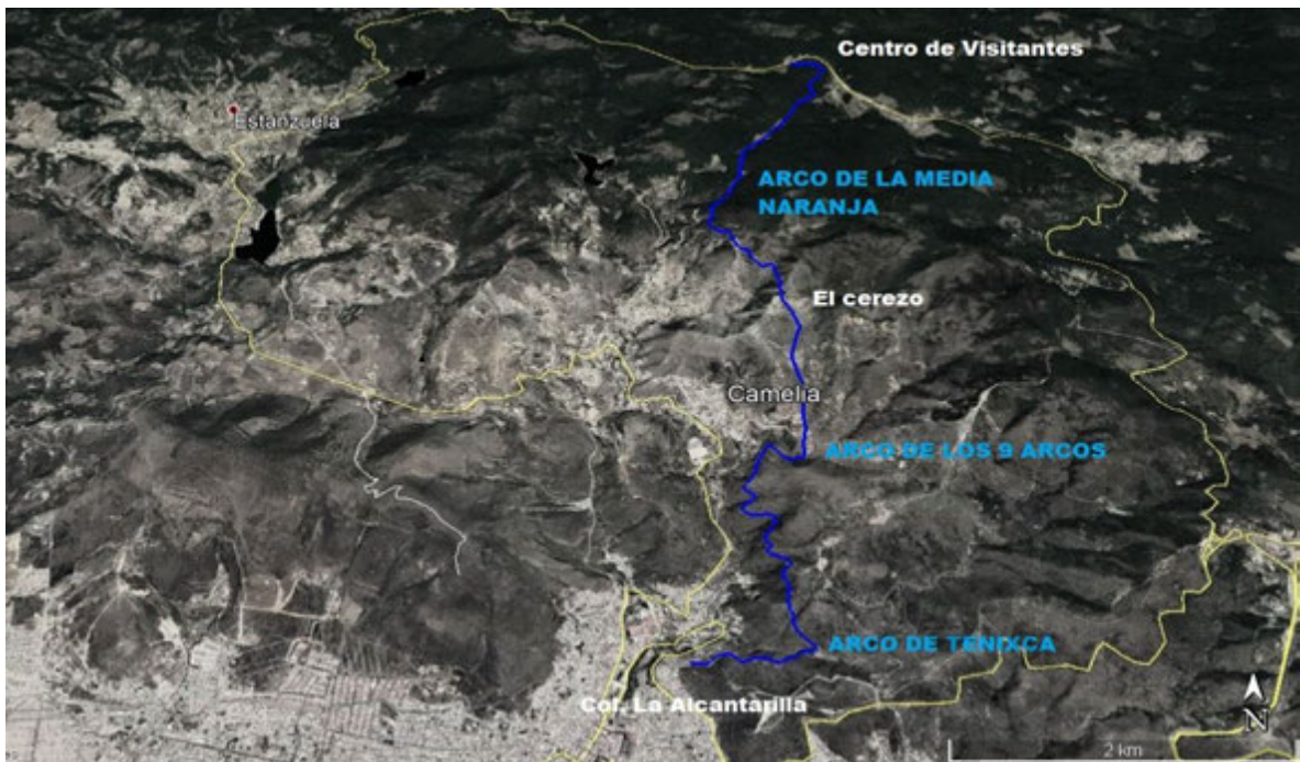
Trazo realizado con GPS marca Garmi fénix 3 por C. Zenón rosas Franco y utilizando Google ERTM