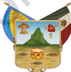
Estado Libre y Soberano de Hidalgo